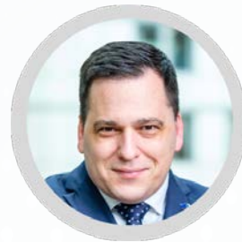
Tomáš Zdechovský Poslanec Evropského parlamentu